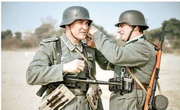
Due attori durante una pausa delle riprese in esterna

Ciak sul documentario del regista latisanese A fine autunno la prima al cinema Odeon