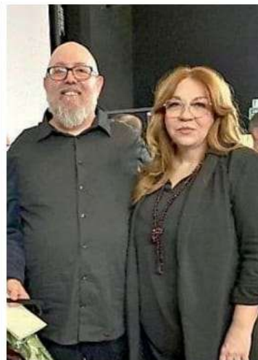
Doremi e Carraro

Dopo le prime visioni al cinema Odeon di Latisana e al Cinecity liganese il documentario ha iniziato il percorso dei festival, costellato da numerose selezioni ufficiali e apprezzamenti da parte di giurie nazionali e internazionali. Questo premio però attesta la capacità del film di coinvolgere e interessare un pubblico anche oltre i confini nazionali. Per gli autori, «il risultato costituisce un incoraggiamento a proseguire nell'atti-