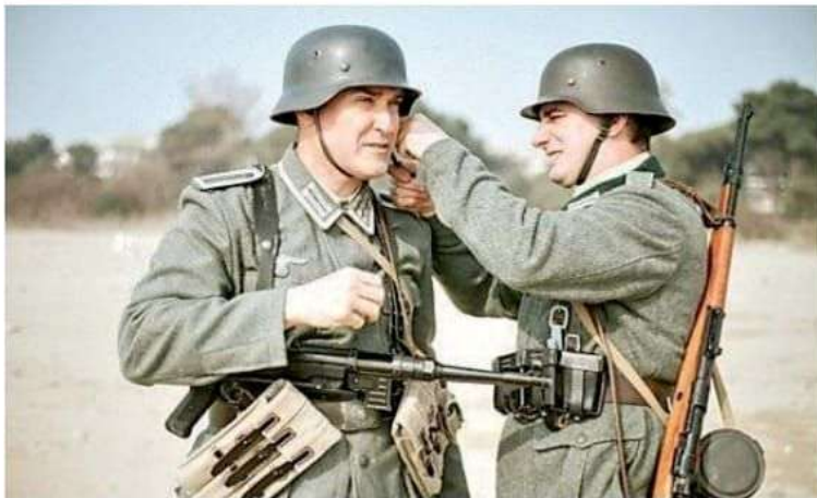
Due attori durante una pausa delle riprese in esterna

Ciak sul documentario del regista latisanese A fine autunno la prima al cinema Odeon