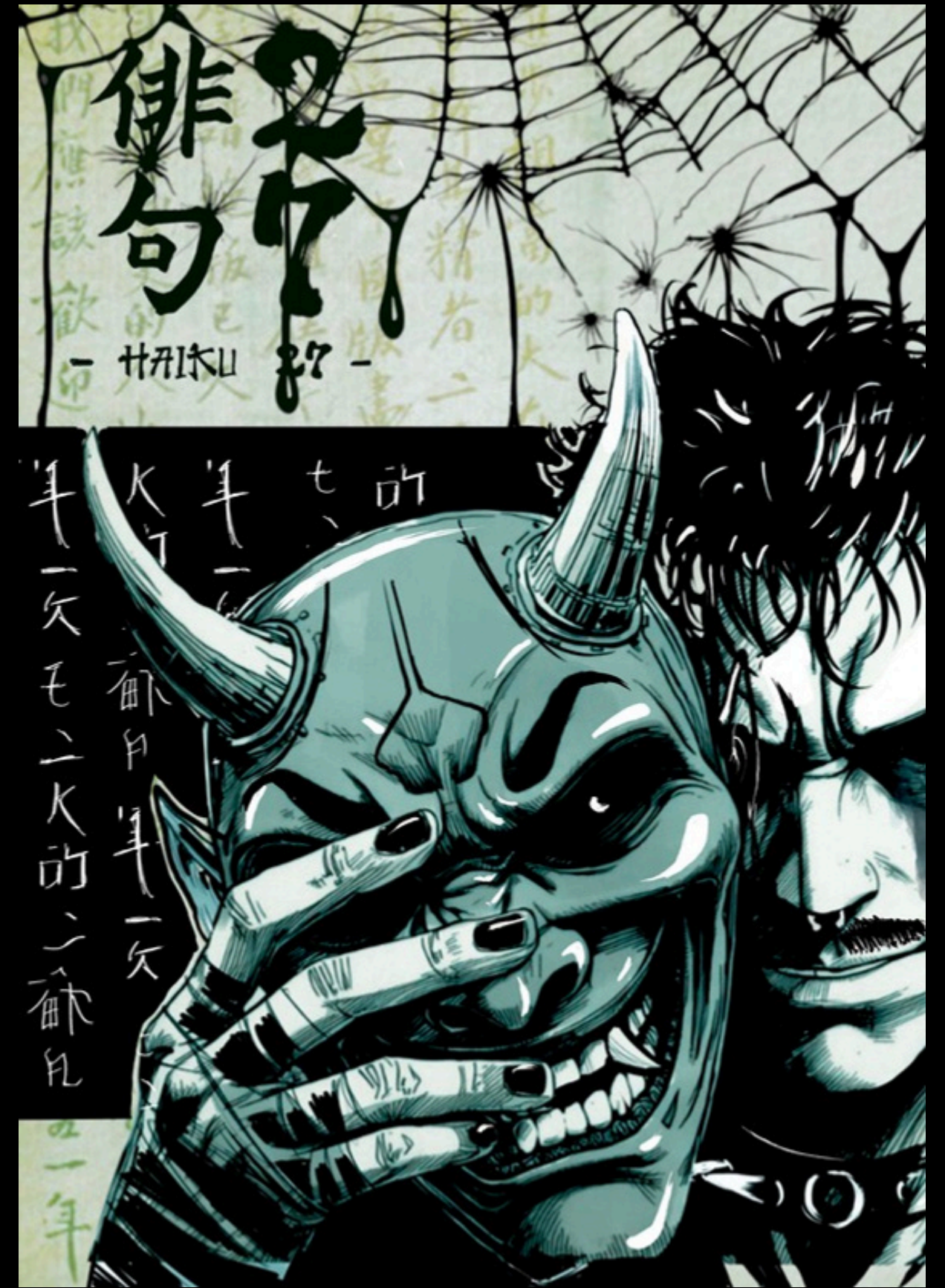
(Bozza di copertina)