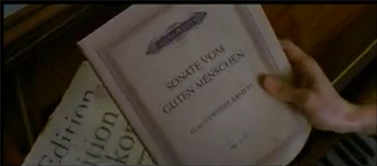
SONATA FOR A GOOD MAN