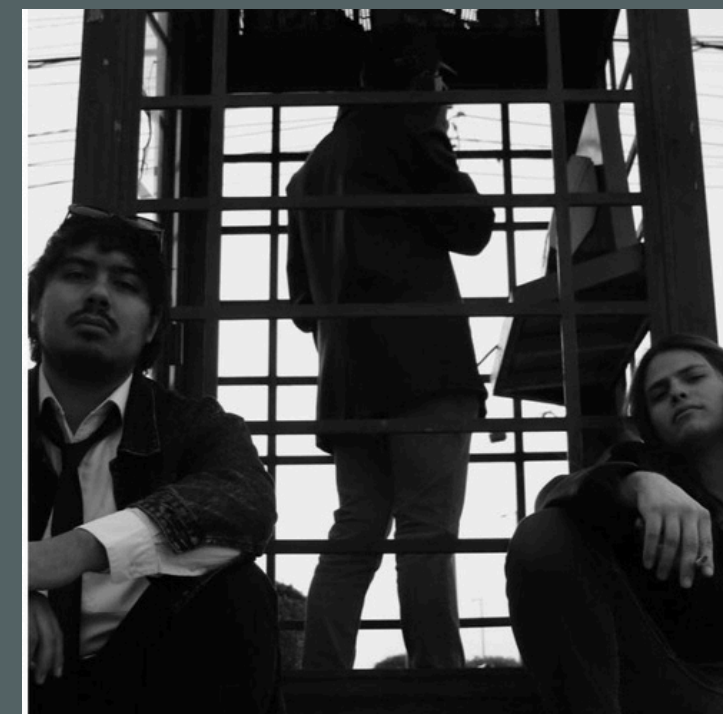
OH, SANJI!, MÚSICA