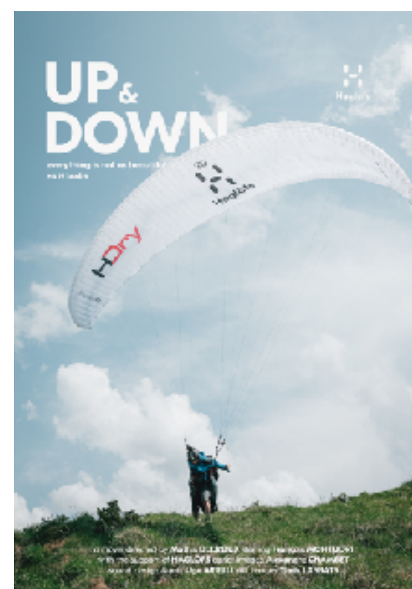
UP & DOWN, 2023