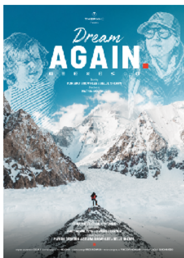
DREAM AGAIN, 2024

Mon site internet : www.mathisdecroux.com / www.risingstory.fr