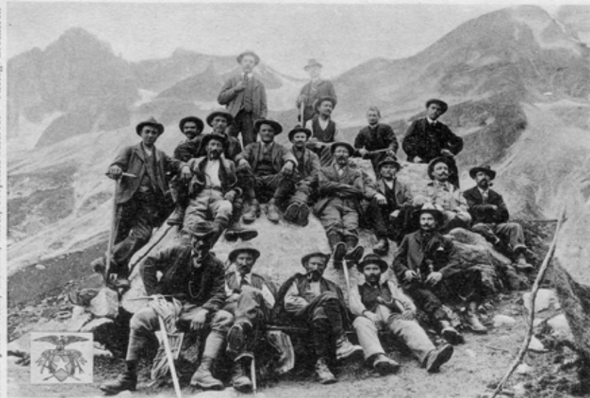
Courmayeur (Vallée d'Aoste)