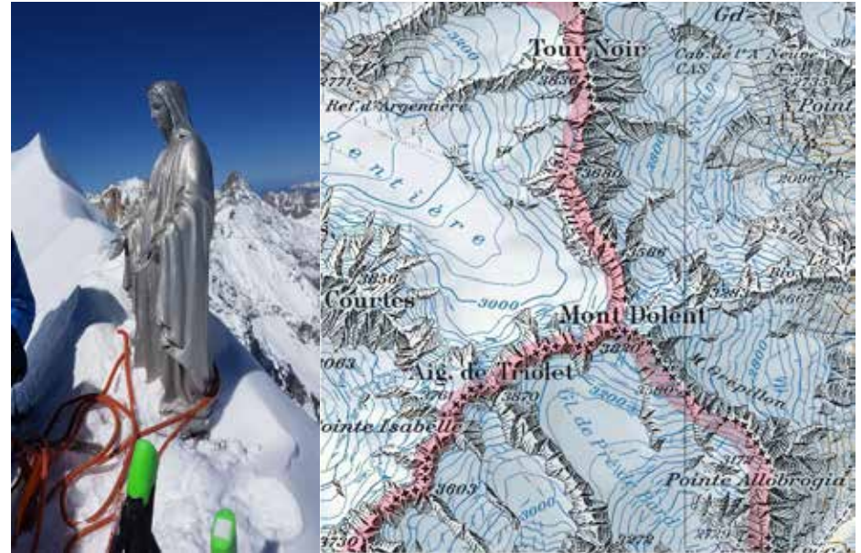
Vierge du Mont Dolent à 3819 m