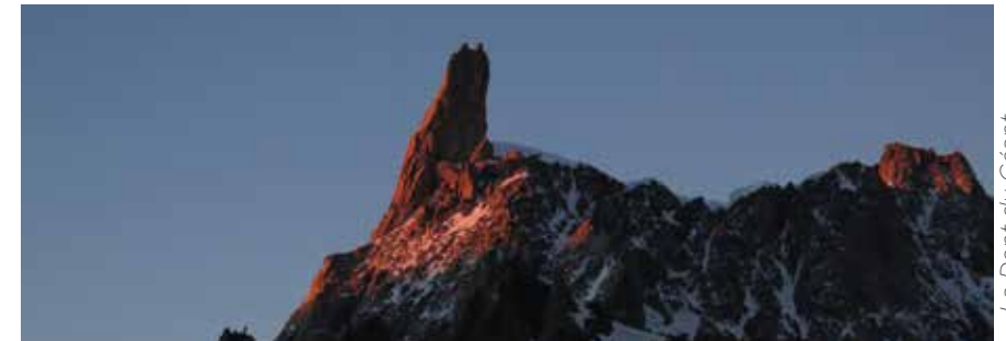
La Dent du Géant

Même en l'absence de foi, il demeure toujours agréable de savoir béni par le curé local !