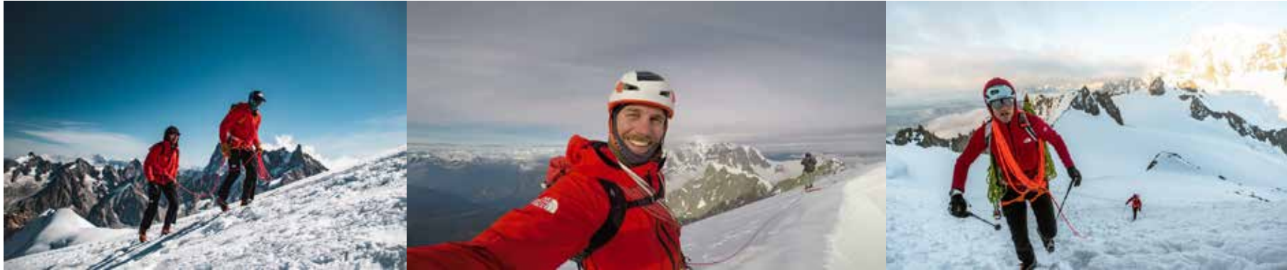
Repérage juin 2023 - En route vers le Mont Dolent (3819m), Aiguille Noire de Peuterey (3773m), et approche du Portalet (2985m)

Bien sûr, nous ne pouvons pas passer inaperçus aux yeux de la presse nationale et spécialisée, mais toujours dans la discrétion de cette entreprise, nous avons pu méticuleusement mettre notre itinéraire au point. Ne courant que les sommets les plus complexes afin de vérifier le dispositif des voies et affiner l' approche photographique .