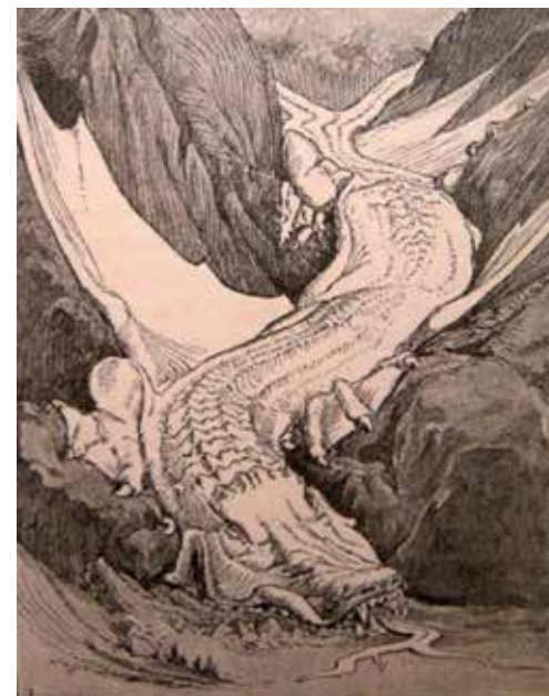
Wilderwurm-Gletscher Gravure de H.G. Willink (1892)

Les années passent, les accidents aussi et les générations de guides se succèdent jusqu'à nos jours.