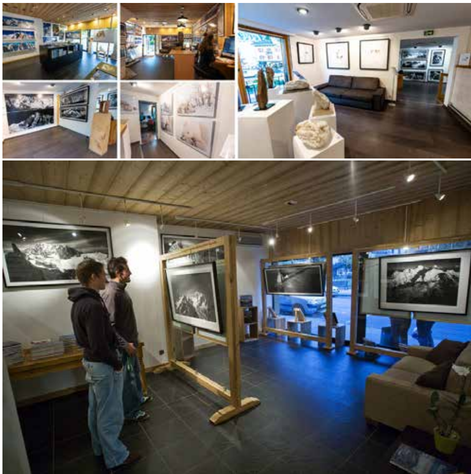
Galerie de Mario Colonel à Chamonix

de leurs attentes et l'escalade se révèle particulièrement ardue. Le granit est recouvert d'une fine pellicule de glace qu'il faut sans cesse briser à coup de piolet pour loger des coinces et toutes les prises sont humides ou recouvertes de neige. Ici la météo est encore plus imprévisible que dans le reste du massif, avec des orages soudains et des tempêtes redoutables. La madone qui trône là-haut, parmi un va-et-vient continue d'épais nuages sombres, est à la hauteur de la réputation de son socle immense. Alors que Guillaume parvient enfin au sommet, il enlace cette petite statue qui semble si fragile dans cet endroit si hostile. La Madone est là devant lui et sa présence ici prend alors étrangement tout son sens : elle est, comme nous l'a dit Catherine Destivelle : "le phare de l'altitude" , condamnée à subir les éléments : le vent, la pluie, la foudre, la morsure impitoyable du gel. Celle qui rappelle aux grimpeurs épuisés par le mauvais temps qu'ils ne sont pas seuls au monde malgré les apparences. En effet, comme nous l'avouera Mario Colonel : "la montagne n'est pas qu'un lieu de rire et de joie" .