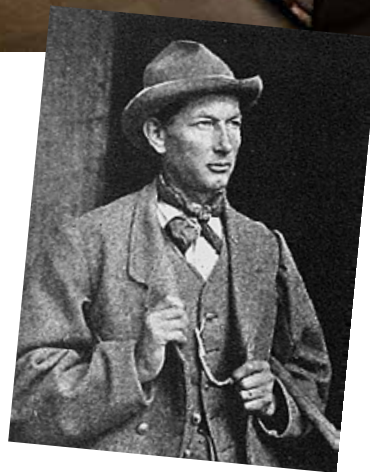
Portrait d'Émile Rey