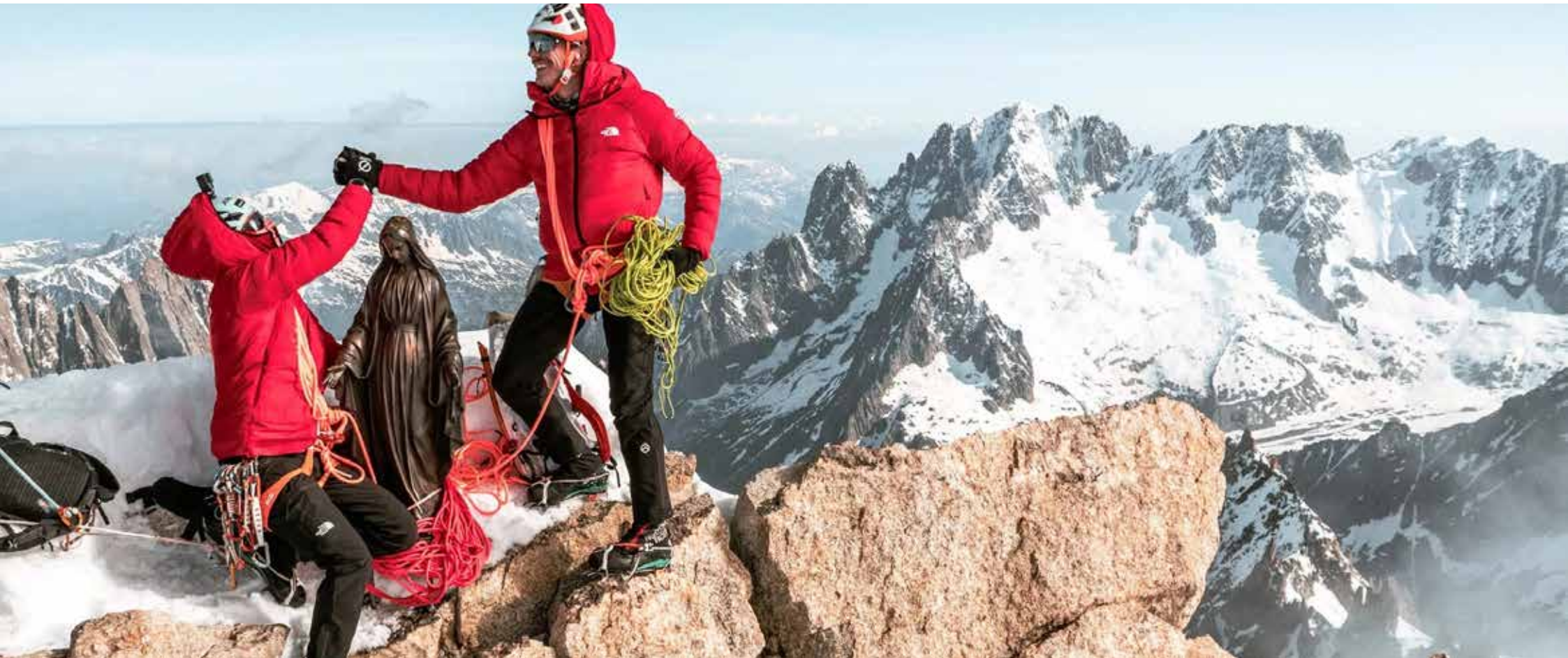
Sommet de la Dent du Géant à 4013m