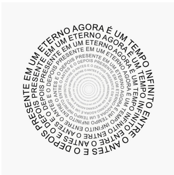
Figura 2- “Agora é já” (Tchello d'Barros, 2013)

constitui tanto o início como o fim da frase remetendo à noção da temporalidade”. Parece repetir o círculo eterno do tempo e do eterno retorno do mesmo do tempo cronológico, com supremacia do agora sobre o passado e o futuro. Aqui, temos um presente muito maior, que é “infinito sem ser ilimitado: circular no sentido de que engloba todo o presente, ele recomeça e mede um novo período cósmico após o precedente, idêntico ao precedente” (DELEUZE, 1975, p. 191).