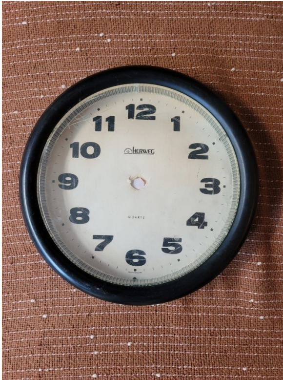
Figura 3- "A abolição do tempo" (Alex Hamburger, 2024)

infinitas vezes com as duas direções da linha de Aion.