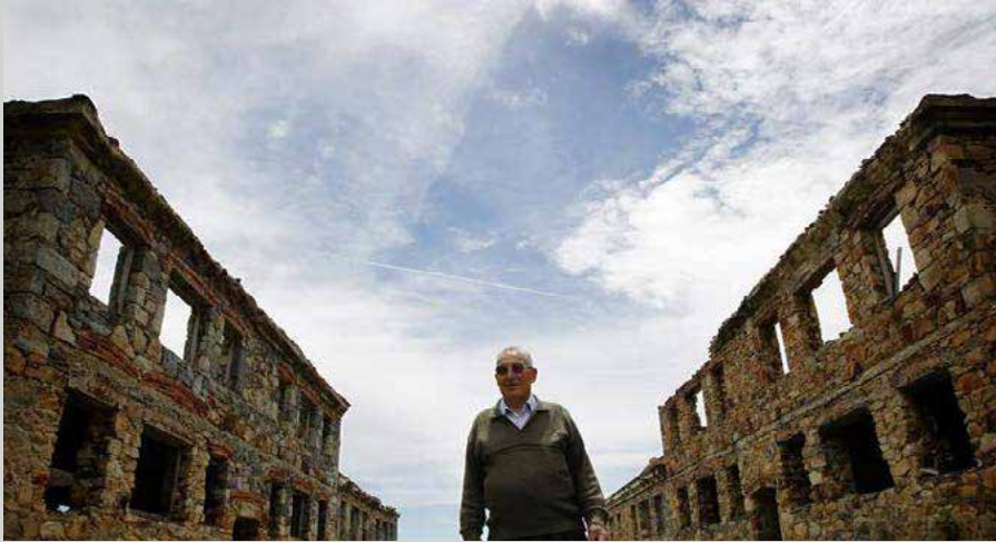
El Poblado de la Pielá

A finales de 1952 se inició su construcción por parte de los mineros de la mina de wolframio. Adoptó el nombre de la zona donde se localiza. El poblado estaba compuesto por 41 viviendas de las cuales hoy apenas quedan dos con los techos en pie. El declive de la explotación minera es la principal causa del abandono del poblado que en la actualidad se encuentra en la Lista Roja del Patrimonio Nacional.