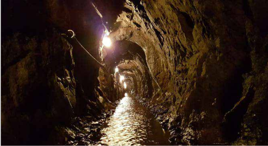
La Mina del Seo

Su actividad se data en torno al año 1940 cuando empezó a extraerse wolframio de manera furtiva y anárquica. Un mineral muy cotizado a raíz de la II Guerra Mundial ya que era utilizado para endurecer el acero de los blindados y los misiles antitanque. Alemanes y aliados pugnaban por su compra que lo llevó a tener un precio desorbitado. Acabada la II Guerra su extracción dejó de ser tan ventajosa. Aun así el periodo de mayor auge de la explotación tuvo lugar entre 1950 y 1953 durante la Guerra de Corea. El declive y posterior cierre de la mina se produjo en 1958. El precio del wolframio se desplomó y los Norteamericanos no renovaron el contrato.