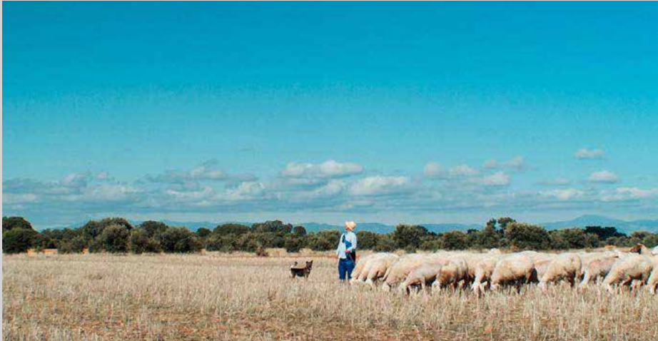
Meseta - Juan Palacios, 2019

En 2019 me llegó la inspiración a raíz de “Meseta”, el documental que rodé con el director Juan Palacios y que trataba el tema de la España vaciada. Fue entonces cuando decidí ubicar la historia en el presente pues me permitía, por un lado, abordar el tema desde un punto de vista inaudito y, por otro, me daba la posibilidad de mezclar otras problemáticas como la situación actual de los pueblos de la zona del Bierzo (la España vaciada en contraste con el auge de población que hubo en los años cuarenta por el Wólfram) y la complicada situación de la juventud de hoy en día. De este modo, además, tenía la enorme ventaja de poder sacarle el máximo partido a las incomparables localizaciones del poblado de la Piel y Las Minas del Seo.