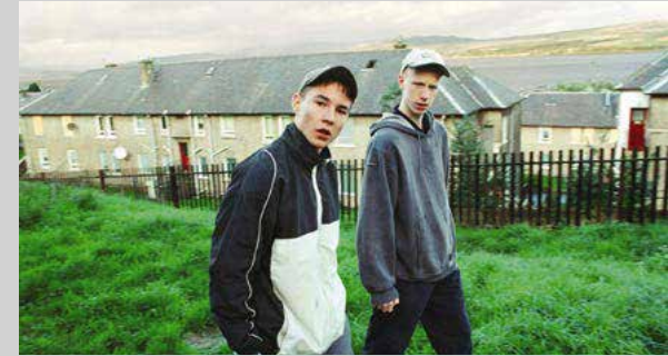
Sweet Sixteen - Ken Loach, 2002

A modo de resumen comentar que el proyecto está pensado para ser rodado con lentes angulares que puedan proporcionarnos esa naturalidad que buscamos, con mucha profundidad de campo y evitando el desenfoque a medida de lo posible. Un tono naturalista que trabajaremos con iluminación natural en el exterior y con una luz práctica en las escenas de interior para poder mantener una cierta coherencia estética.