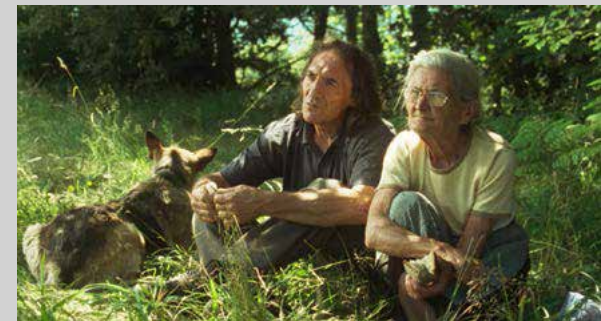
O Que Arde - Óliver Laxe, 2019