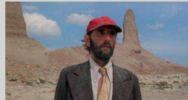
Paris, Texas - Wim Wenders, 1984