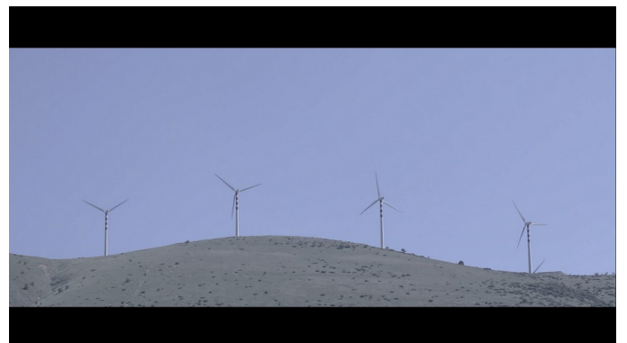
Figura 10: una scena del film