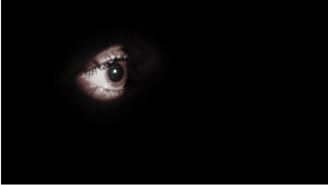
Figura 6: Giorgia Starinieri