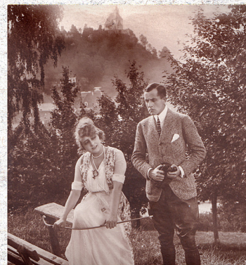
Das einzig existierende Setfoto des Films, Drehort ist Friesach

Auch die Liste der Drehorte konnte Pertl vor Kurzem erweitern. Friesach, Villach, Zollfeld, die Burg Hochosterwitz und der Wörthersee wurden bereits dank Fotos von Dreh, Filmplakaten oder Filmkader (Abschnitte von Filmrollen) identifiziert. „In einer Universität in Uppsala ist ein Plakat der