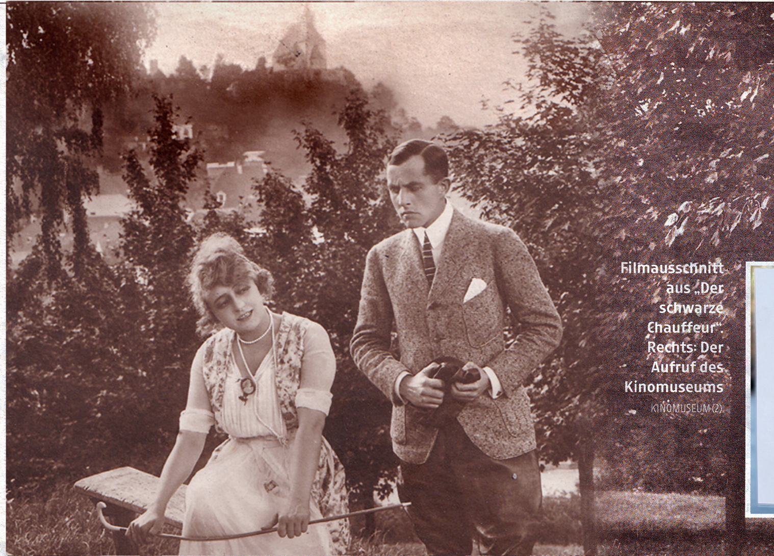
Filmausschnitt aus „Der schwarze Chauffeur“. Rechts: Der Aufruf des Kinomuseums