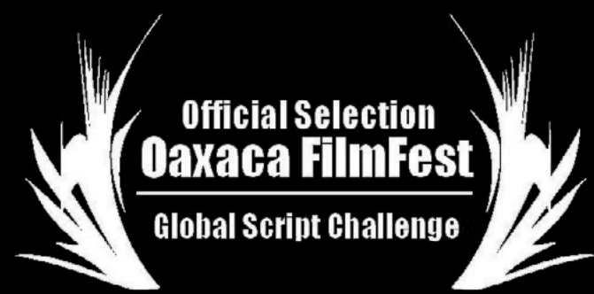
Selección de guion