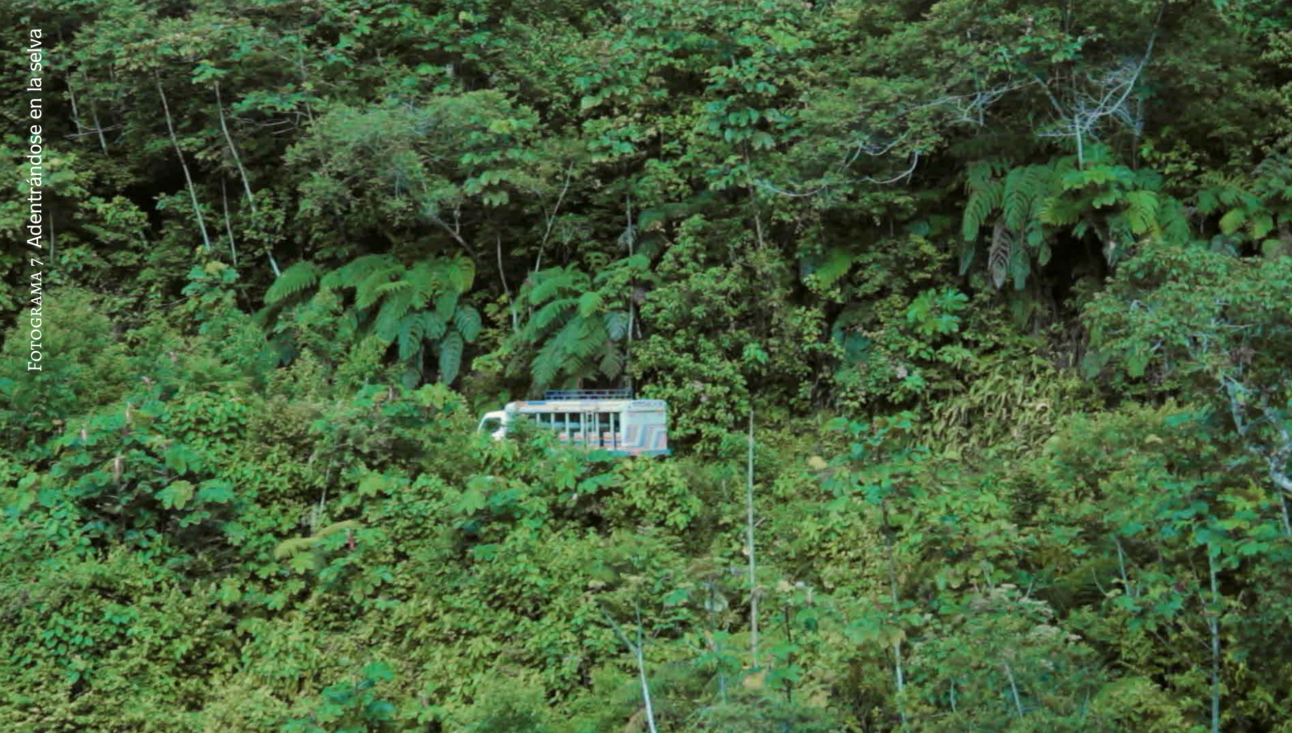
FOTOGRAFÍA 7 Adentrándose en la selva