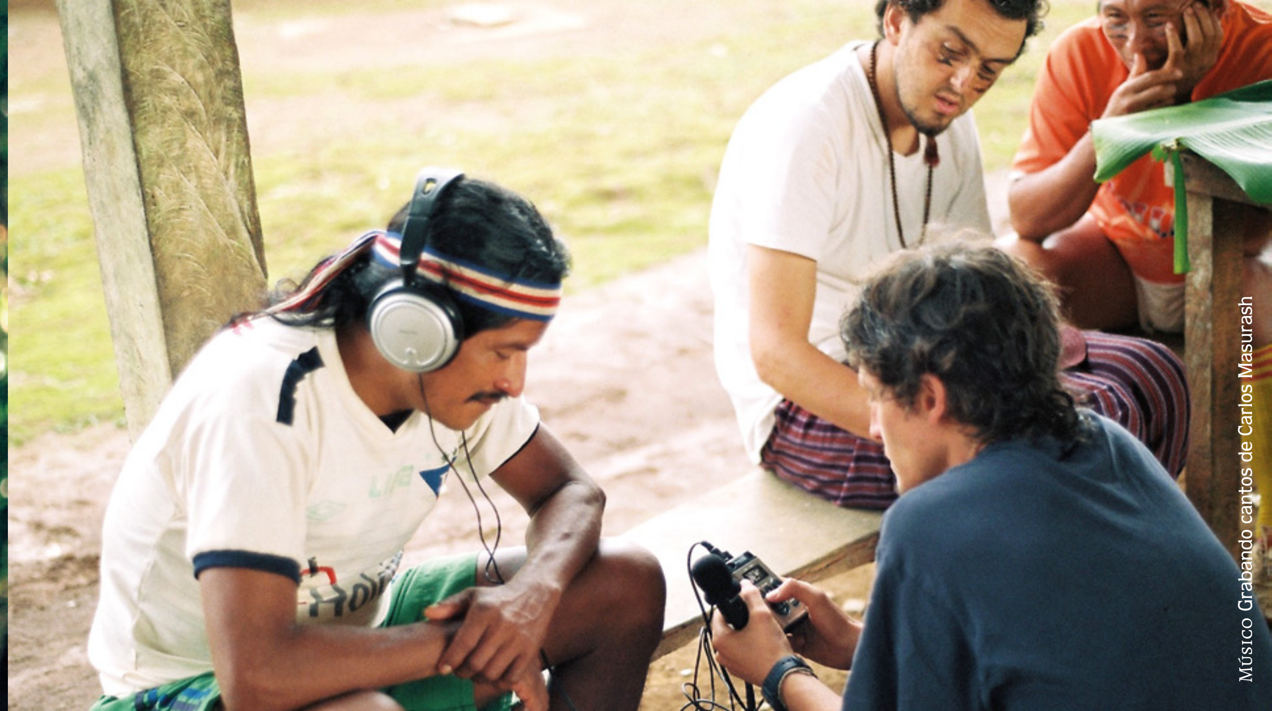
MÚSICO Grabando cantos de Carlos Masurash