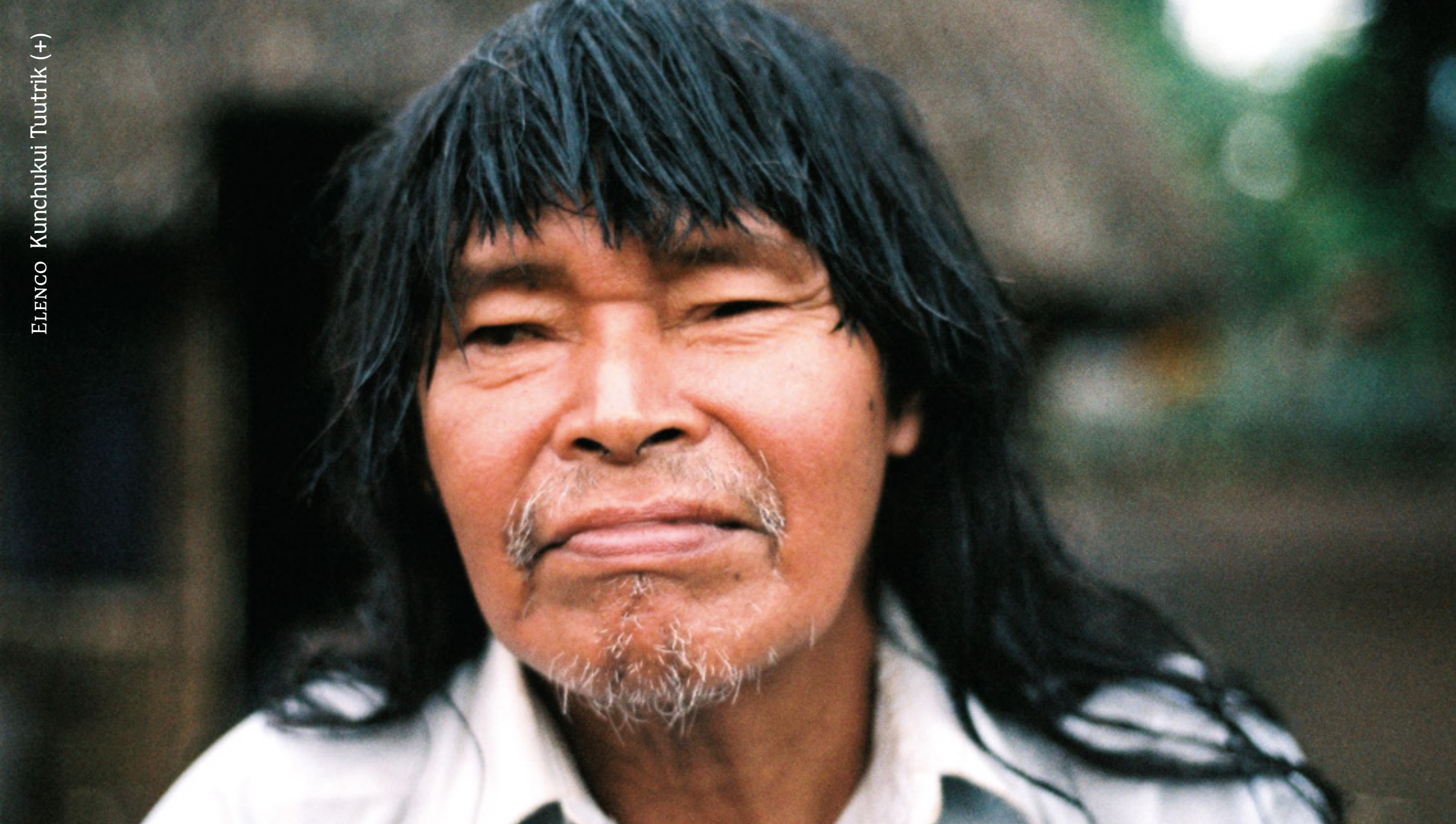
ELENCO Kunchukui Tuutrik (+)