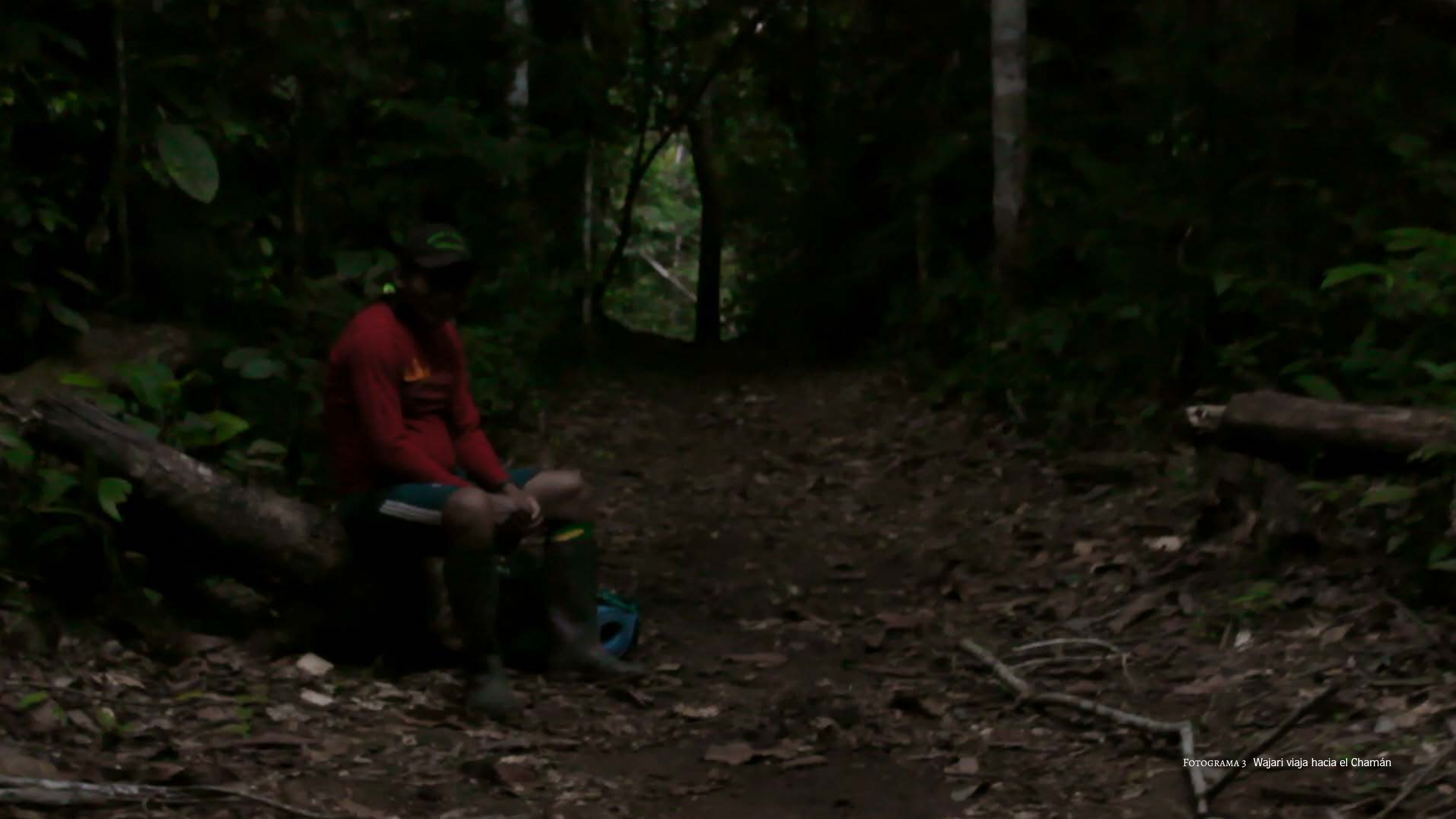
FOTOGAMA 3 Wajari viaja hacia el Chamán