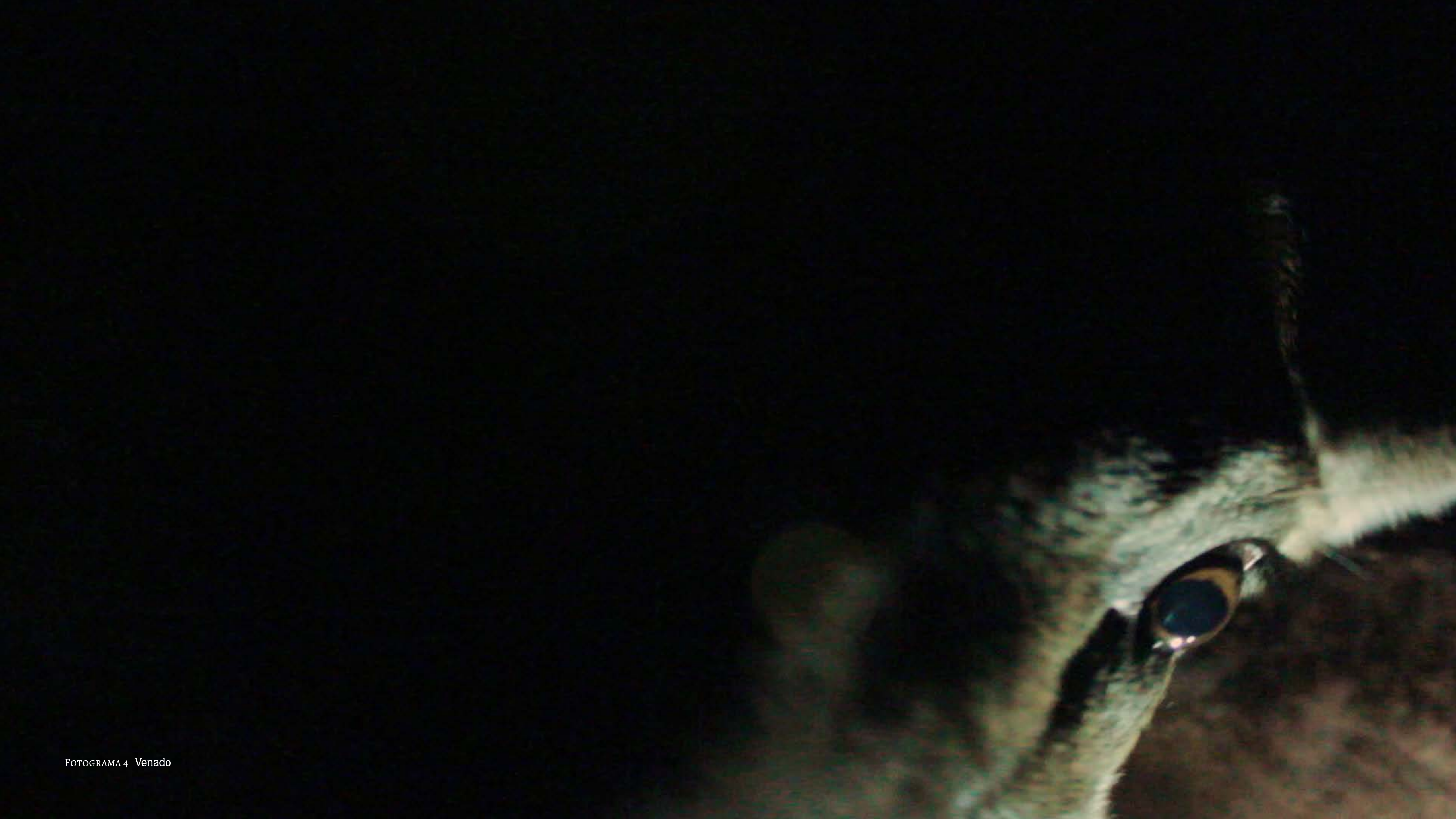
FOTOGRAMA 4 Venado