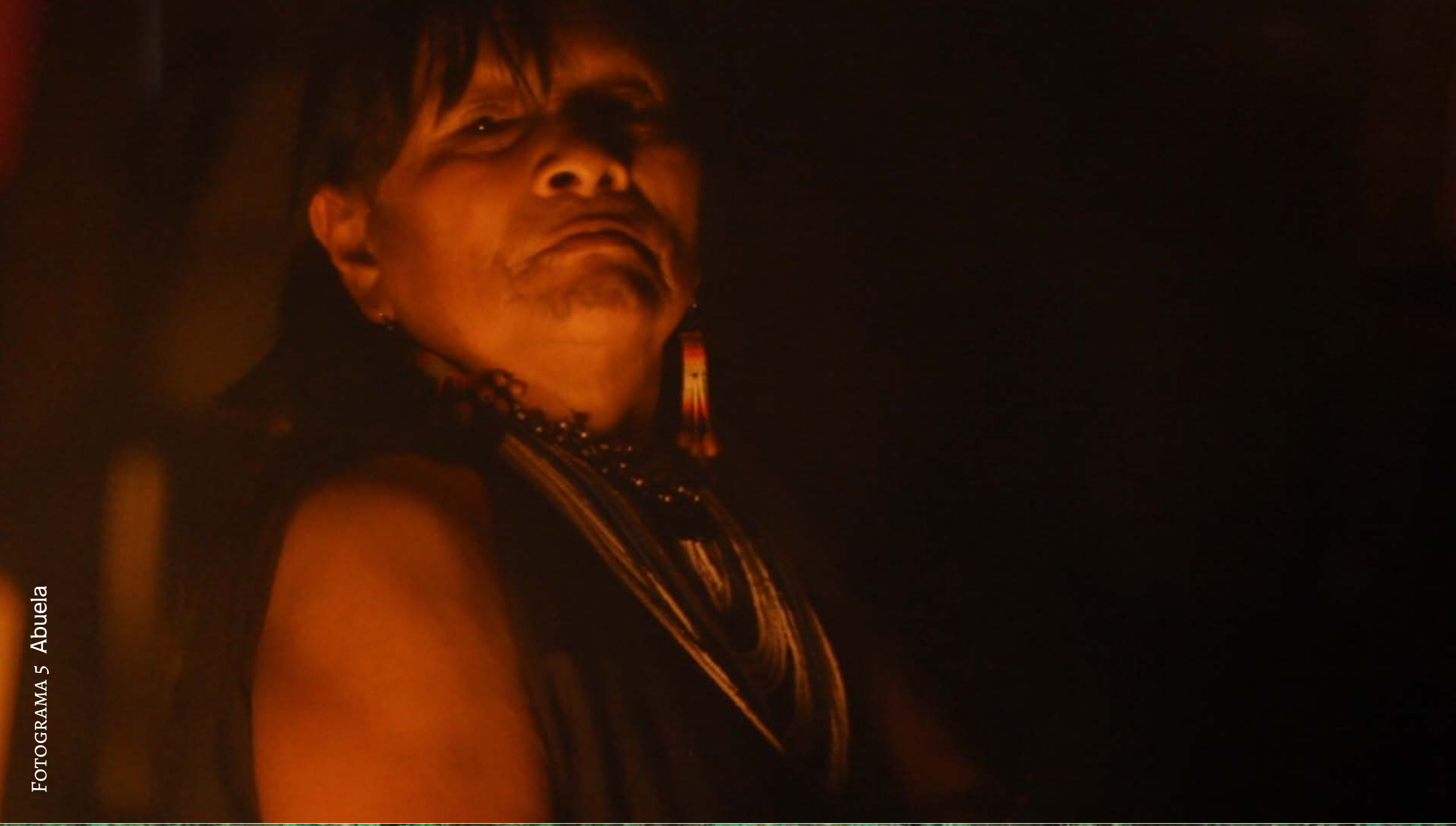
FOTOGRAFÍA 5 Abuela