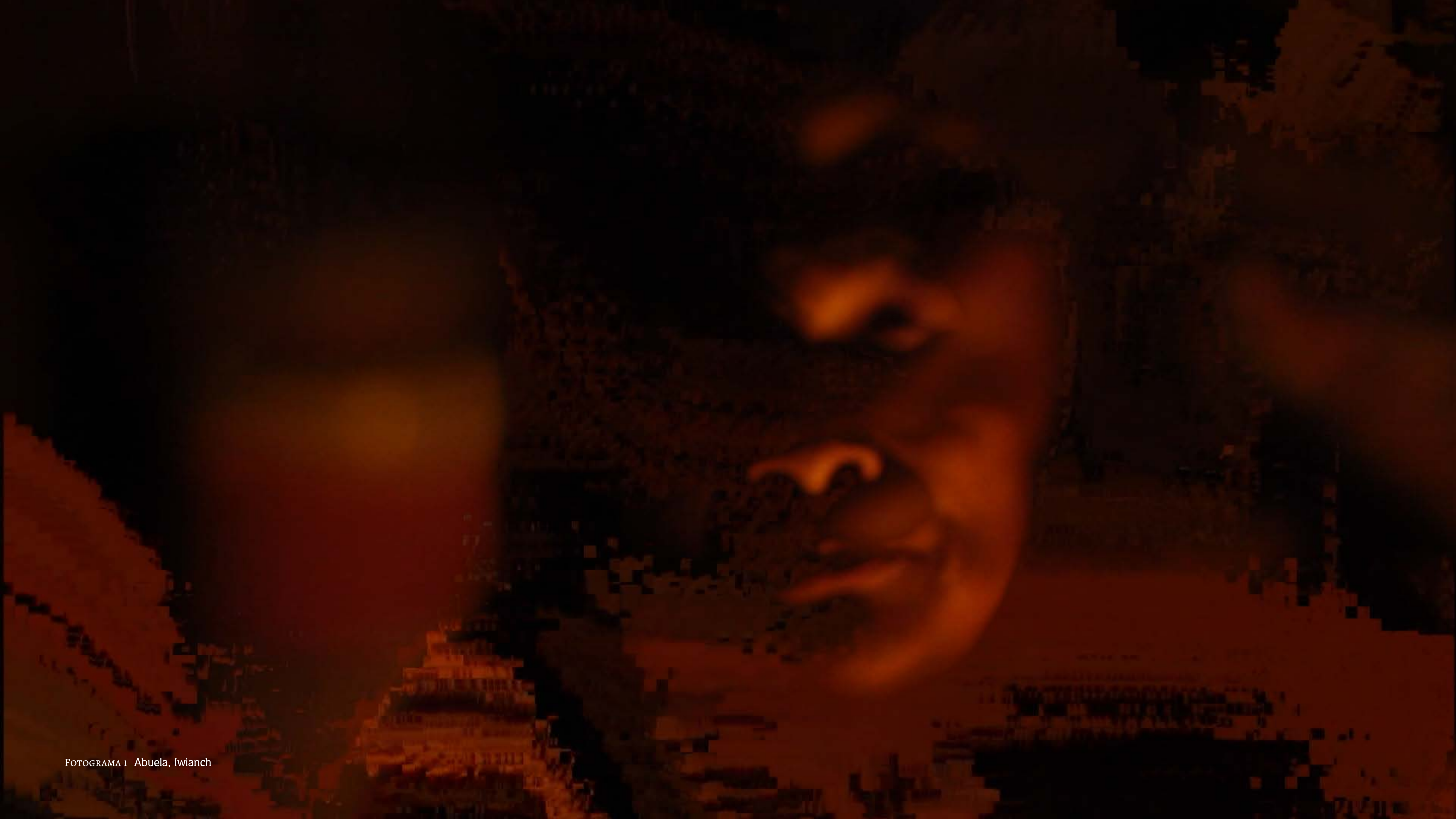
FOTOGAMA 1 Abuela, Iwianch