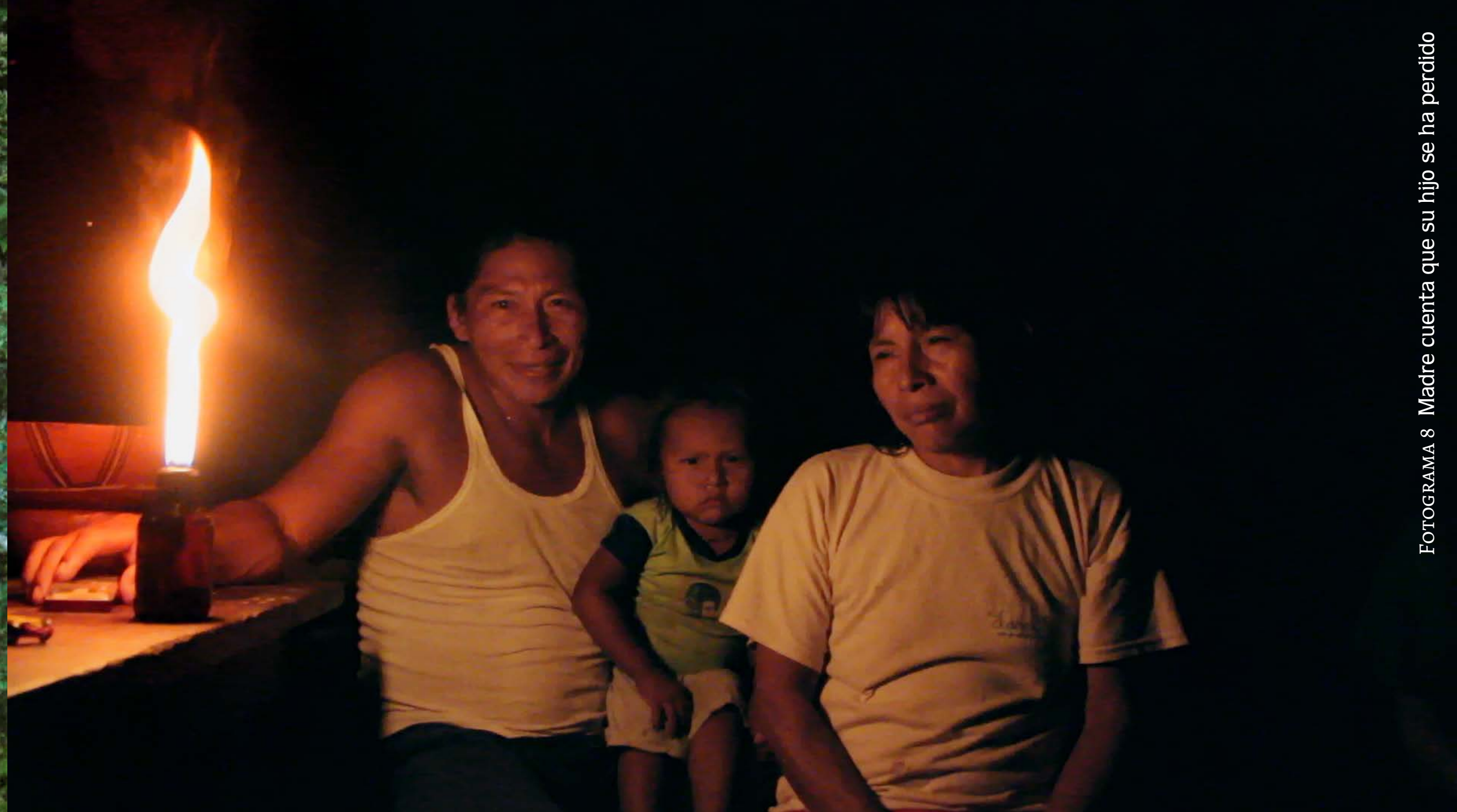
FOTOGRAFÍA 8 Madre cuenta que su hijo se ha perdido