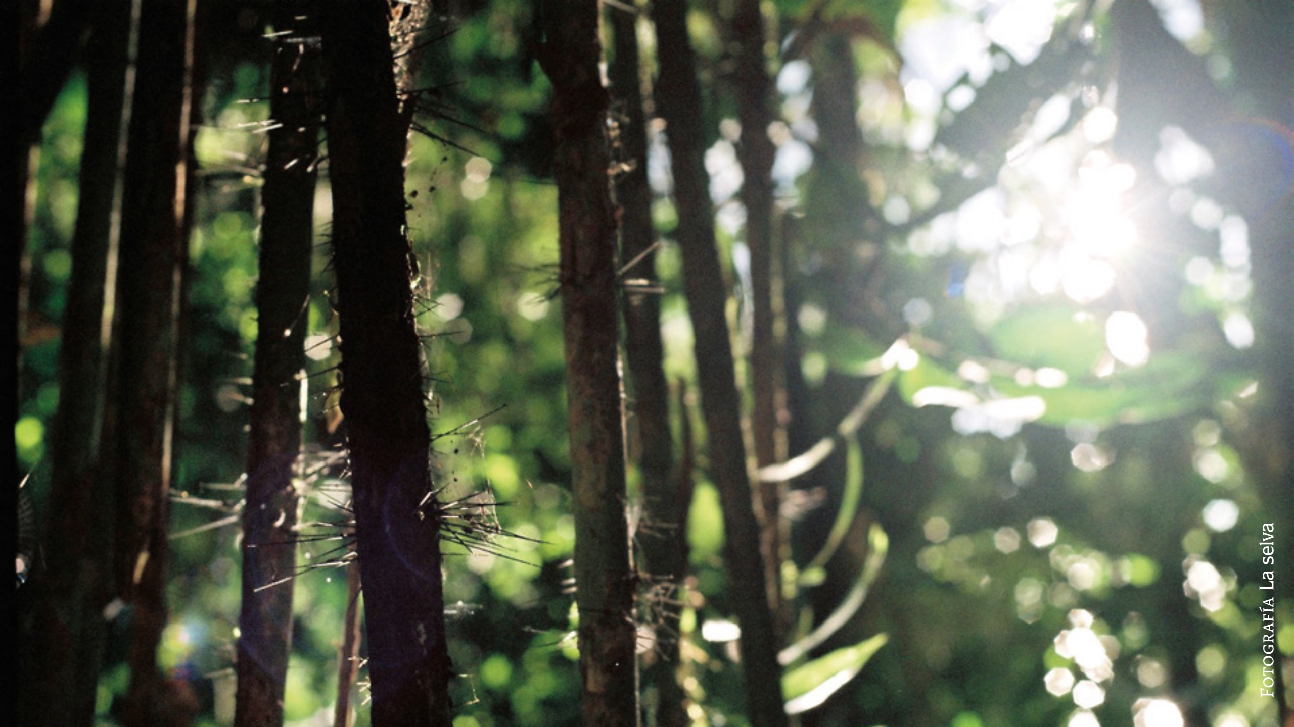
FOTOGRAFÍA La selva