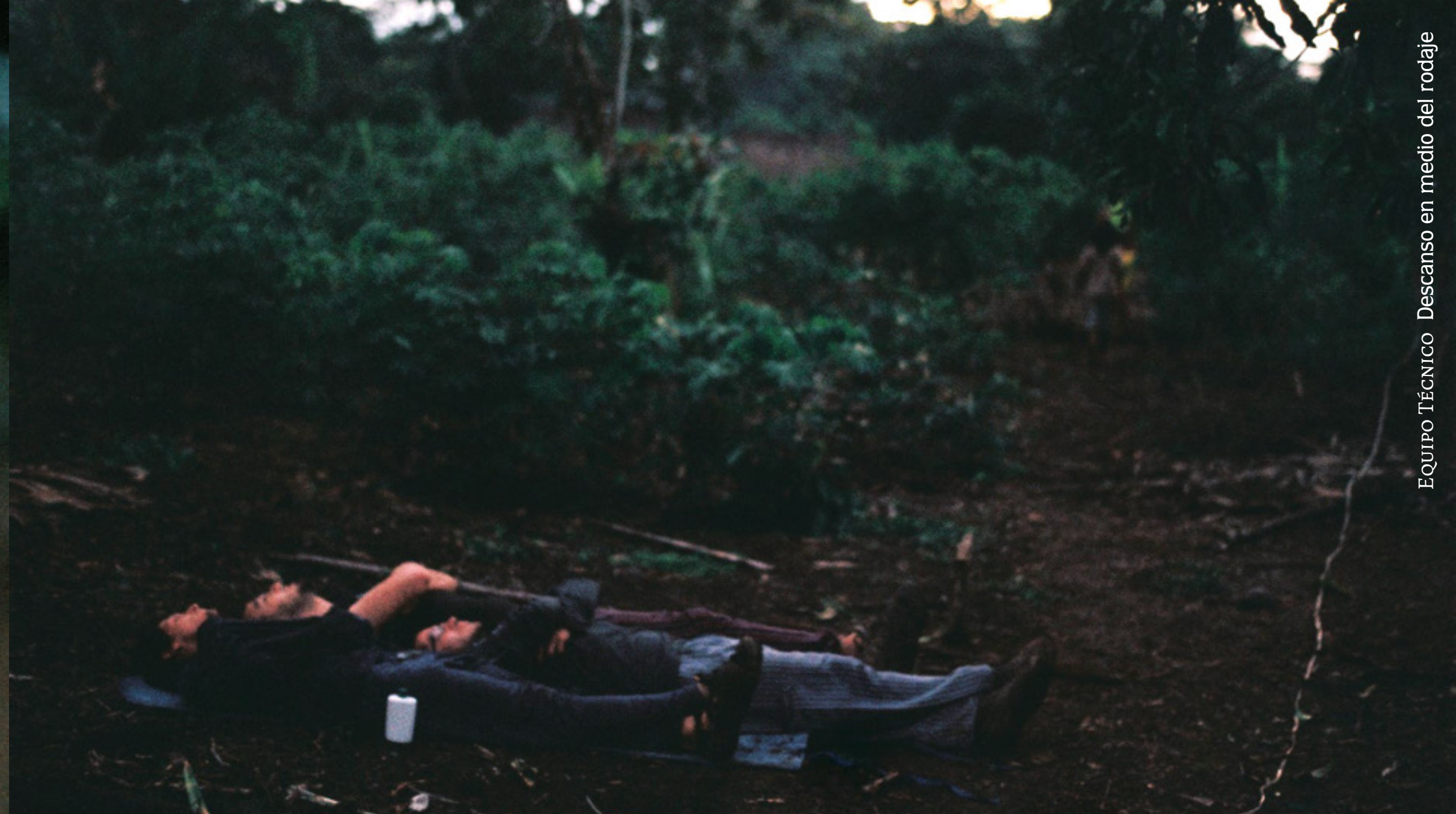
EQUIPO TÉCNICO Descanso en medio del rodaje