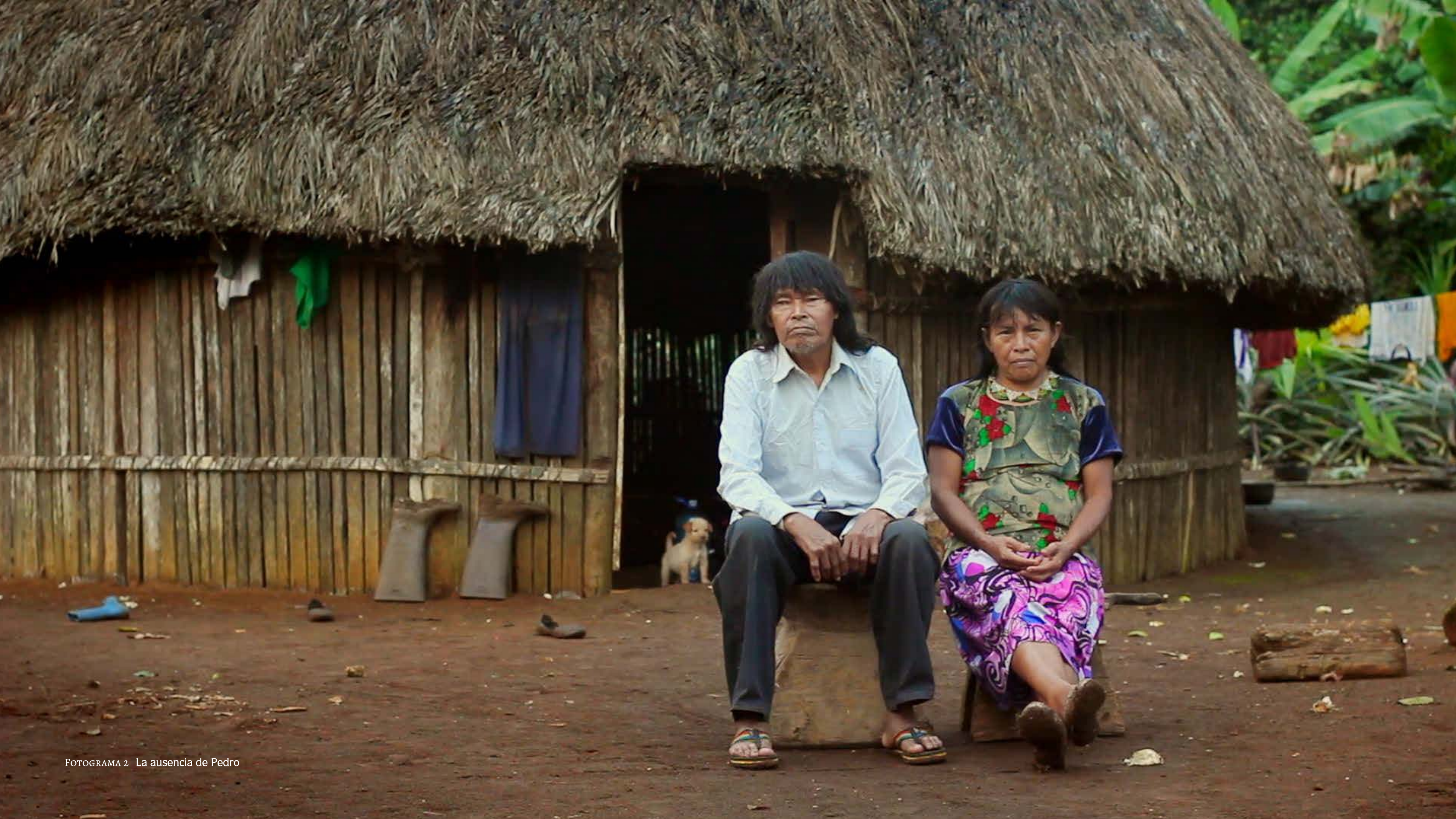
FOTOGAMA 2 La ausencia de Pedro