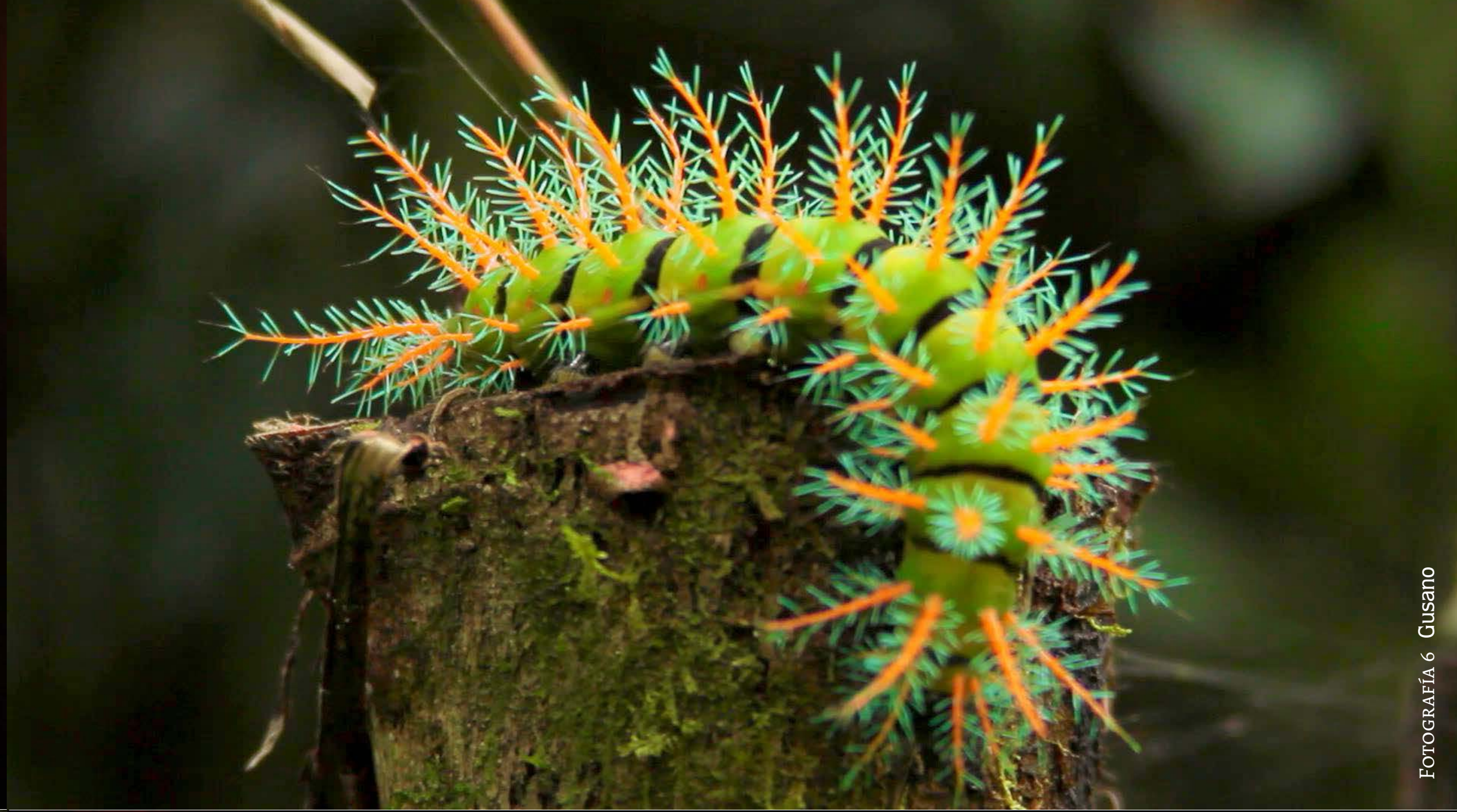
FOTOGRAFÍA 6 Gusano