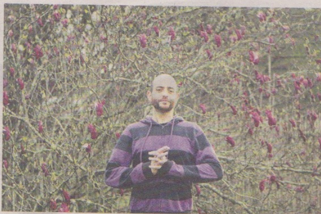
GIRALT Un cinéfilo voraz. Su nueva película es protagonizada por Erica Rivas.