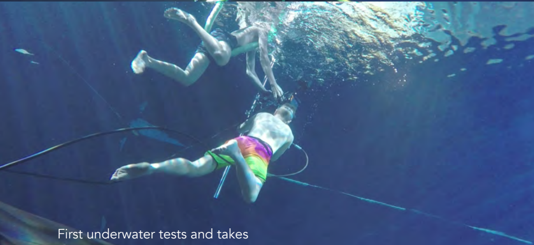
First underwater tests and takes