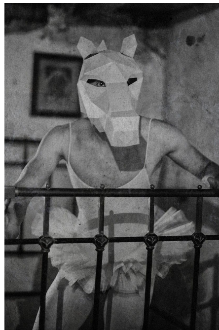
El hombre caballo / L'homme cheval El hombre caballo