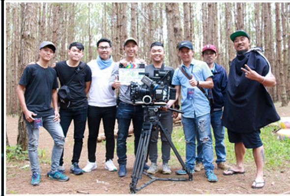
CAMERA OPERATION TEAM