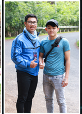
ONSET SOUND RECORD