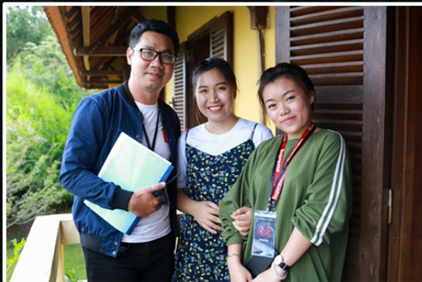
ONSET WARDROBE TEAM