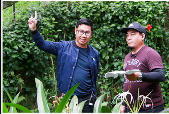
DIRECTOR & D.O.P