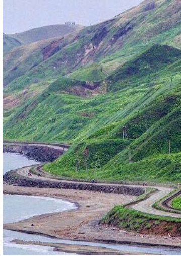
2015 Сахалин– Санкт-Петербург