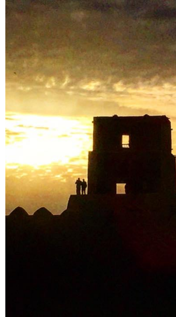
2017 Вокруг Каспийского моря