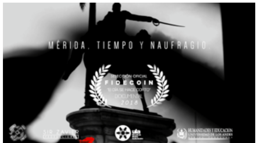
Mérida, Tiempo y Naufragio. / Mérida, Time and Shipwreck. (2018) Documentary Short Film.