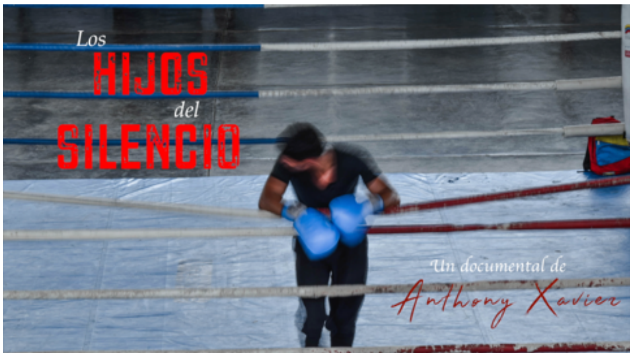
Los Hijos del Silencio / The Sons of Silence (2018)