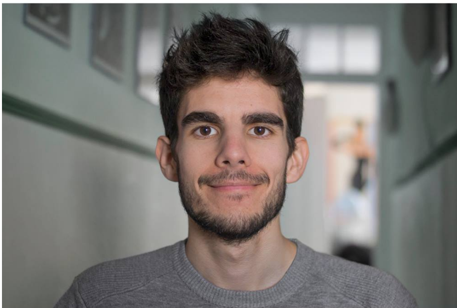
NOVISSIMO O jovem realizador estreia em sala a sua primeira longa-metragem, que também realiza