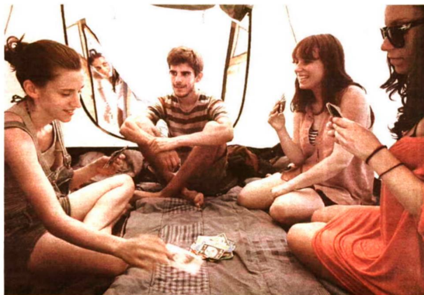
Memórias de um tempo especial

Depois do IndieLisboa, o filme já percorreu um longo caminho desde a estreia internacional no 17.º Festival de Xangai. As seleções em festivais de países tão diferentes é sinal de que tem conteúdo e abertura suficiente para que diferentes culturas se interessem, e isso deixa-me muito feliz. O objetivo foi fazer o filme para ser projetado nas salas e ter pessoas nas cadeiras, numa dimensão que permite viajar melhor. Depois, espero que seja um contributo para futuros financiamentos ou outro tipo de apoios para próximos projetos. Temos imensa vontade de continuar.