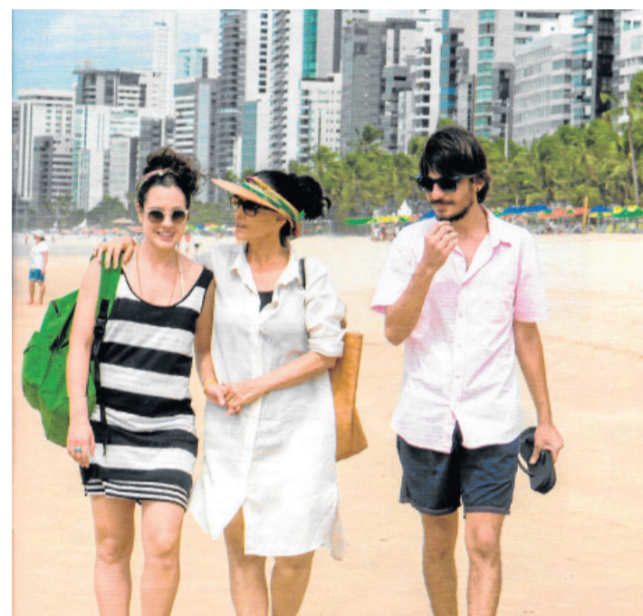
CENA. Sonia Braga, ao centro, participa do elenco da produção