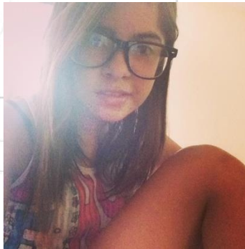
LAURA: Fernanda Romero