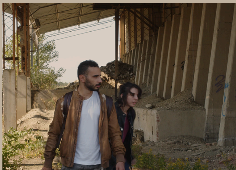
Regia, Sceneggiatura, Videomaking e Montaggio Video