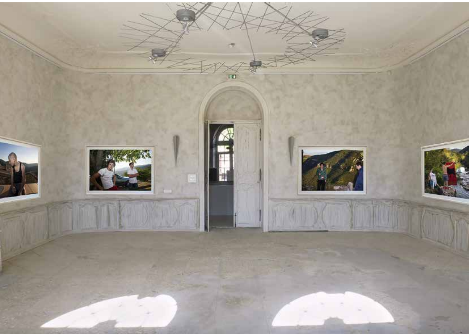
Adrien's Time, 2007