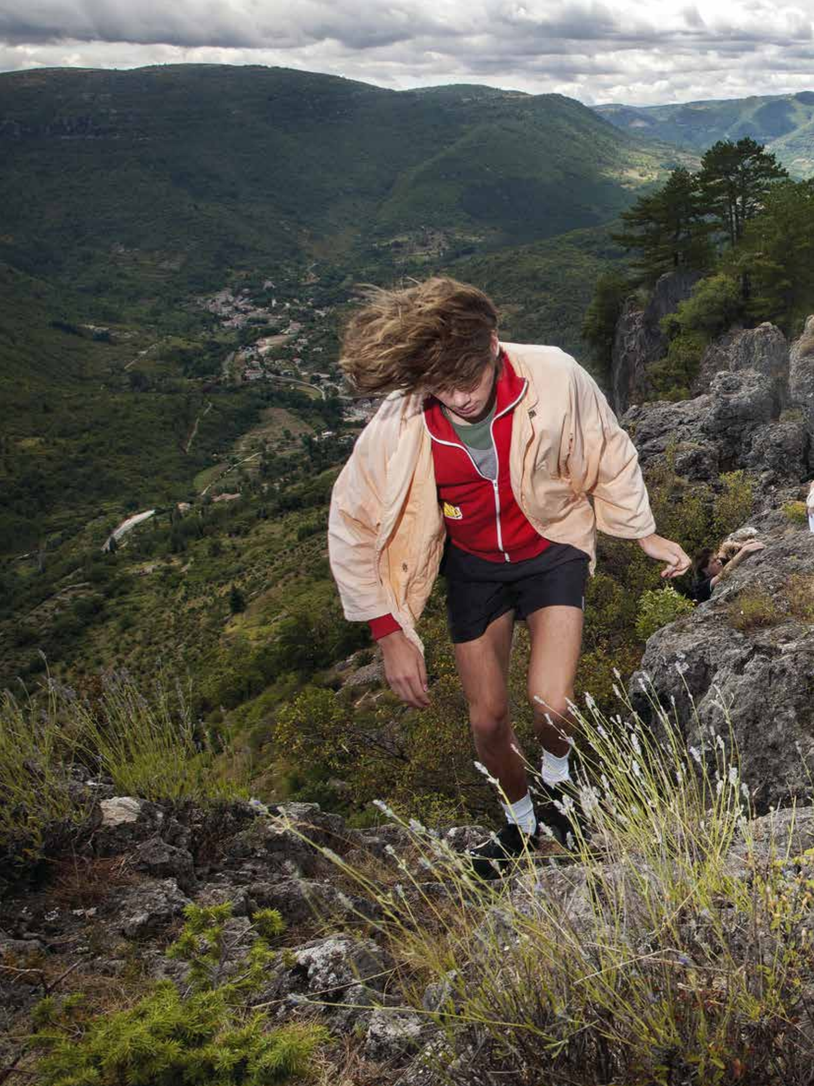
Vigorous Nature, 2008 Nature vigoureuse, 2008