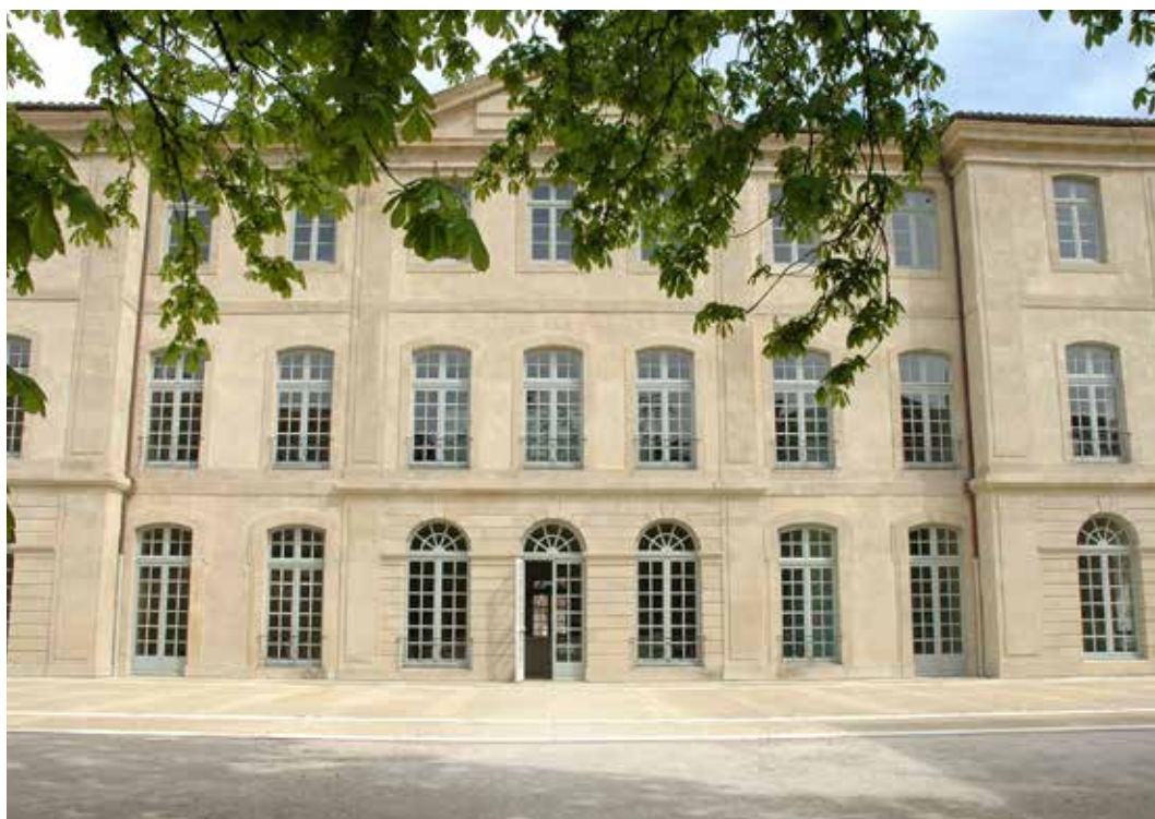
Château d'Assas, Institut d'Art/Art Institute

Cette exposition monographique et cette publication, imaginées dans l'esprit des Lumières, ont été réalisées grâce à de généreuses contributions. Merci aux équipes du Conseil départemental du Gard qui ont produit cette manifestation ainsi qu'à tous les autres contributeurs pour leur disponibilité et pour la bienveillance avec laquelle ils ont accompagné les échanges.