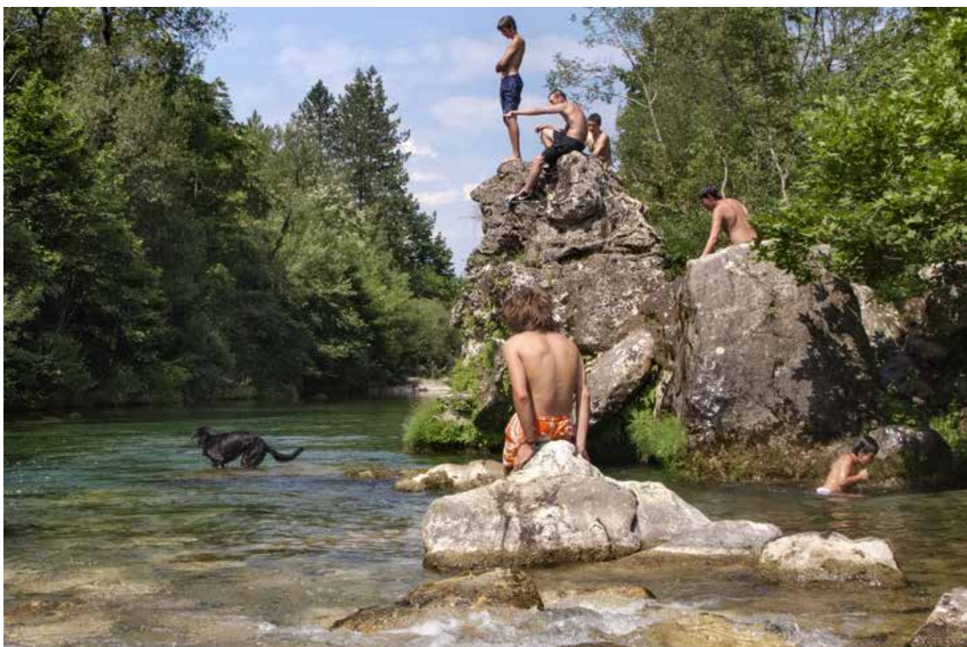
The Boys by La Vis, 2008