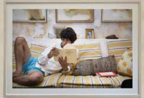
Adrien's Deep Sleep, 2007 Le Sommeil Profond d'Adrien, 2007