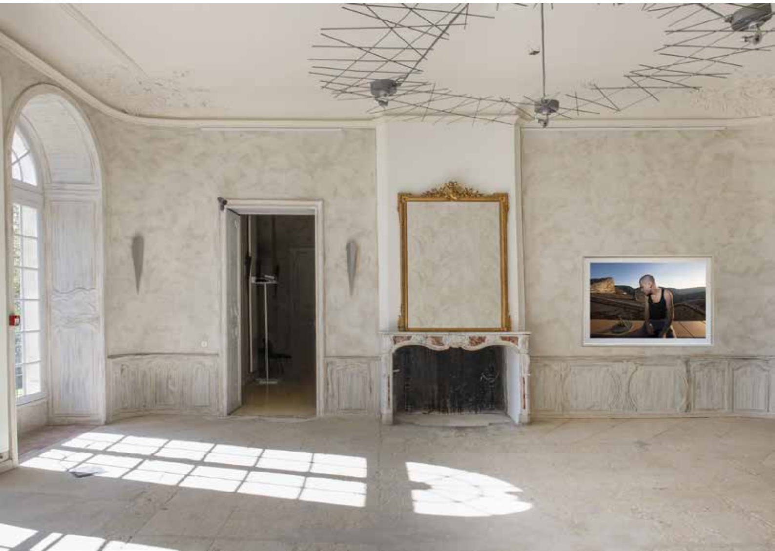
Adrien's Time, 2007 Le Temps d'Adrien, 2007