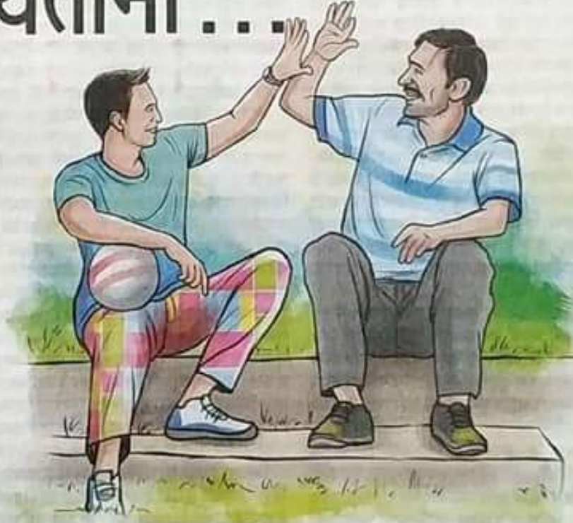
चित्र : अश्विन शिवाकर

६६ स्त्रियांना घरीदारी होणारी मारहाण, शिवीगाळ, त्यांना कायम मुलांच्या तुलनेत मागे ठेवण्याचा प्रकार, अपमान, अतिरिक्त बंधने घातून कळत नकळत वयात येणाऱ्या मुलांमध्ये स्त्रीविषयी चुकीची प्रतिमा तयार होते. त्यांच्यापेक्षा आपणच ब्रेथ आहोत ही भावना निर्माण होऊ लागते, ज्यातून ते बाहेर पडू शकत नाहीत आणि दुर्दैवाने स्त्री अत्याचाराचे आरोपी ठरण्याची भीतीही नाकारता येत नाही.